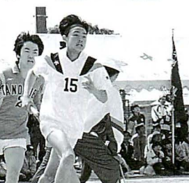
▲中学生リレー(決勝)