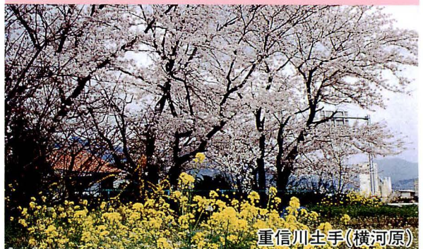
重信川土手(横河原)