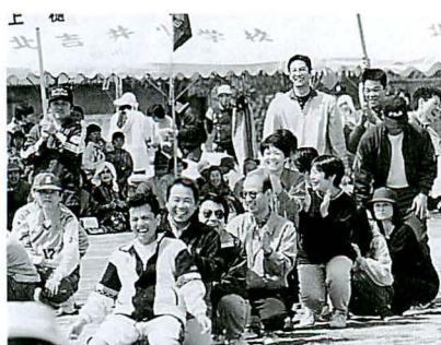
▶当たってよかったね「イエスノークイズ」