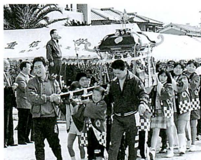
▲▼入場行進に神輿とこいのぼりが登場

四月二十一日、重信中学校グラウンドにおいて、第三十九回町民大運動会が開催されました。 ピン倒し・キャリーでキャッチ・タマ入れ・運だめし・リレーと多くの参加者で盛り上がりました。 また、今年は何年かぶりで、 「聖火リレー」を記念して、