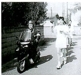
▲◀町内各3地区を出発し、重信中学校グラウンドでひとつになった「聖火」

四月二十一日、重信中学校グラウンドにおいて、第三十九回町民大運動会が開催されました。 ピン倒し・キャリーでキャッチ・タマ入れ・運だめし・リレーと多くの参加者で盛り上がりました。 また、今年は何年かぶりで、 「聖火リレー」を記念して、