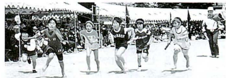
▲小学生リレー(決勝)