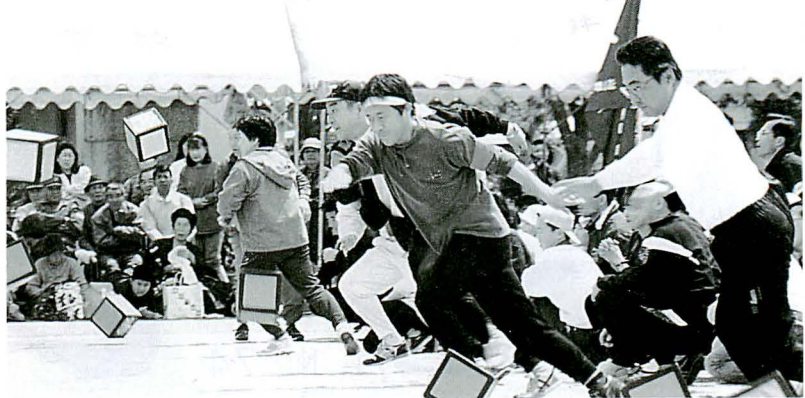
▲さあ どうでるか「運だめし」