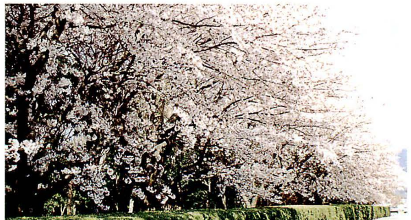
緑化センター(田窪)