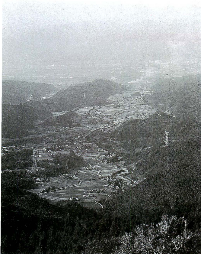
上林・水の元からの重信町