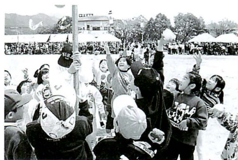
▲小学生による「タマ入れ」(1年生)