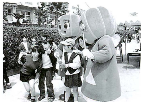
▲初めてお目見え重信町のイメージキャラクター。子ども達にモテモテ