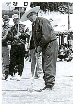
▲綱引き ▲生き生き「グランドゴルフ」