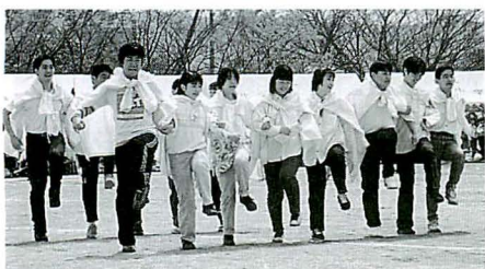
▲「医学祭にきてね」愛媛大学医学部学生によるダンス