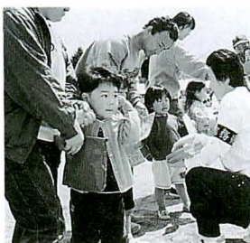
▶おり紙をもらえて「ゴキゲン宝さがし」