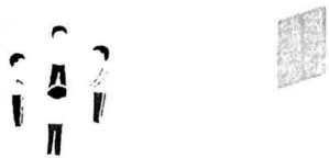
一人ている子いませんか