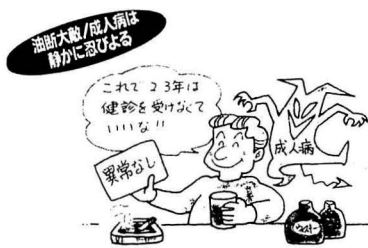
油断大敵/成人病は静かに忍びよる

成人病健診結果報告会を、去る8月から10月にかけて、各公民館で実施しました。成人病健診受診者は923名で、そのうち報告会の参加者は436名でした。 今年の報告会のテーマは「自分でできる健康チェック」です。健康の基本は規則正しい生活を送りストレスをためないことですが、これは簡単なようで難しいことです。 自分の生活が「いい一日だった」といえるか見直してみよう