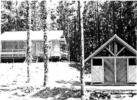
整備された風穴周辺 ③光の森ゾーン ④風の森ゾーン