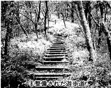
⑧整備された遊歩道

風穴(上林峠経由)上林林道重信線三千二百余メートルはこのように整備されています。← ↓