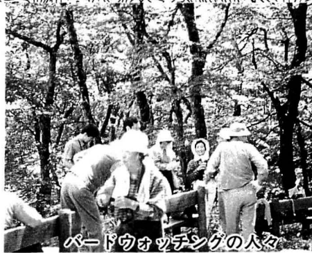
バードウォッチングの人々