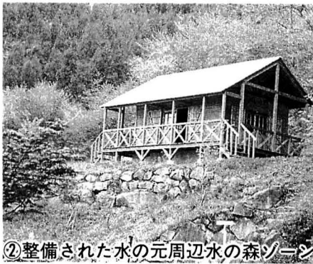
②整備された水の元周辺水の森ゾーン