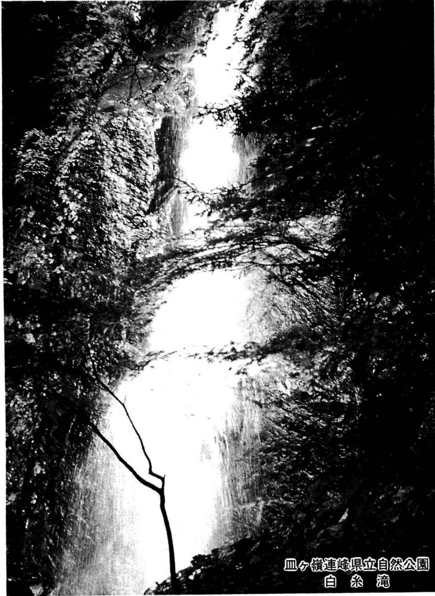
皿ヶ嶺連峰県立自然公園 白糸滝