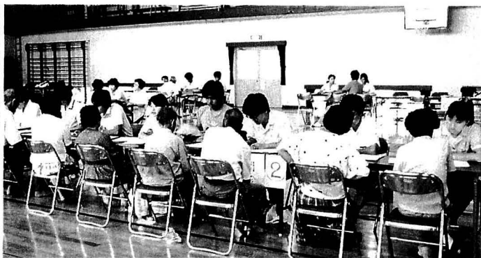
愛媛大学医学部医師による健康診査

塩を取りすぎると血圧が上がります。塩味に慣れ親しんだ人でも、徐々に減塩できることは、重信町上林地区での地域ぐるみの減塩運動のなかでも証明されています。