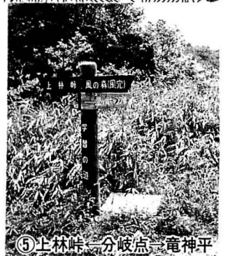
⑤上林峠一分岐点 竜神平