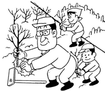
国土緑化強調期間 (3月1日~5月31日)