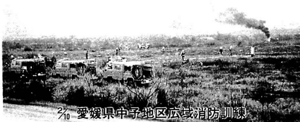
愛媛県中子地区広域消防訓練