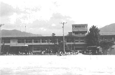
改造される川上小学校本館