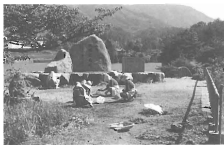
ともしび会による川内公園の清掃

全国各地で様々な活動が 予定され、川内町におい ても観光地の清掃等が予定さ れています。