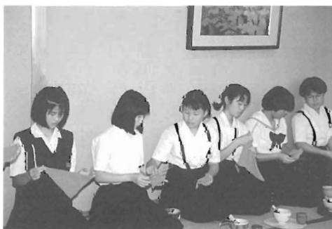
女性らしさがにじみ出てる 茶道クラブの交流