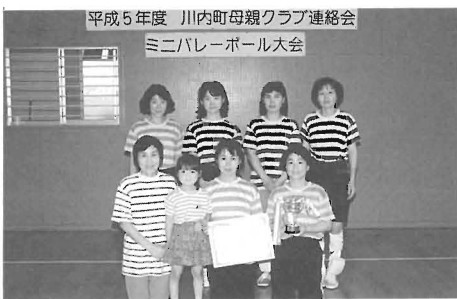
優勝した川幼さくらチーム