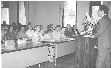
白寿大学でも人権問題の勉強をしています

アジア各国も、先住民が征服国により人権の侵害・迫害を加えられたいたましい歴史があります。日本にも、これと同様に先住民としてアイヌがあり、沖縄があります。