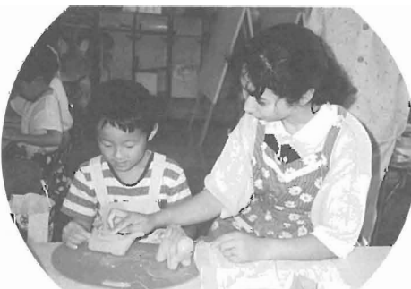
◁ 7/6 西谷幼稚園 砥部焼づくり

水の事故から大切な命を守るため、お母さん達が人工呼吸法の勉強に真剣に取りこんでいます 7/16 西谷幼・小PTA