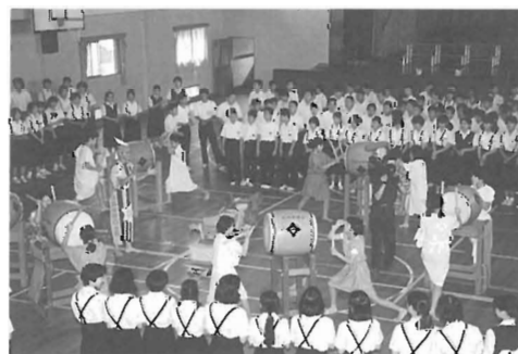
川中太鼓による歓迎式