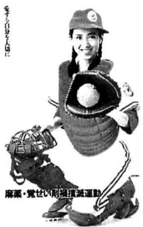
愛媛県 覚せい剤乱用防止センター