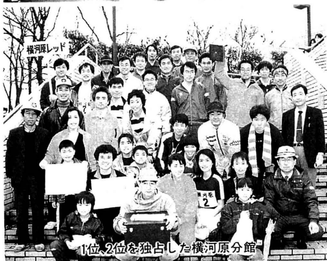
1位、2位を独占した横河原分館