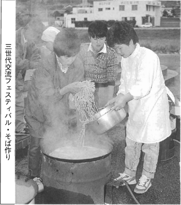
三世代交流フェスティバル・そば作り

が、私にはお醤油を少しの味に向いていました。お餅もおそばも殆ど売り切れ「来年もそばを作ろう。前日に役員で作っておいて、みんなに食べてもらおうよ。」と言って下さる老人クラブの方もいらっしゃいました。