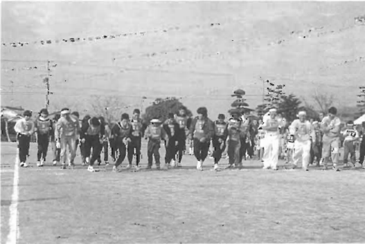
5 kmコース スタート