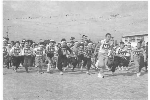
3 kmコース スタート