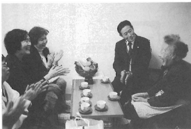
12/17民生委員・婦人会役員による福祉施設訪問