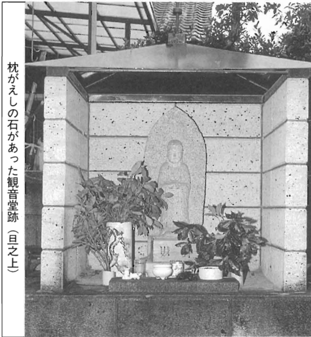
枕がえしの石があつた観音堂跡（且之上）

あつてたまるか。わしが寝てみよう」と物好きな隣人が出かけた。東枕に寝たがやっぱり西枕になつていゝ。それから人の口から口へと噂になり、遠方からもたしかめに来たが評判通りなので、それからこの石を枕がえしの石と呼ぶようになった。最近までその石はあつたが、学校線（川上小学校西から山之内に通ずる道）の道路が拡張された折りに行方不明となつた。