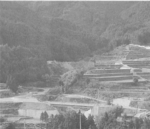
白猪谷セイフティコミュニティ広場予定地