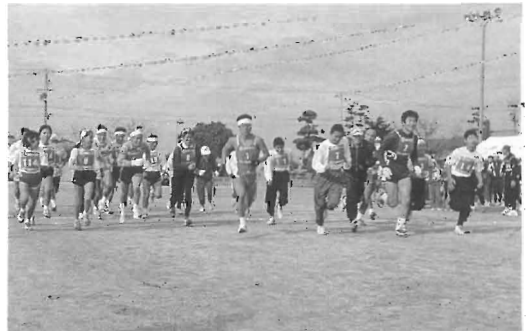
7 kmコース スタート