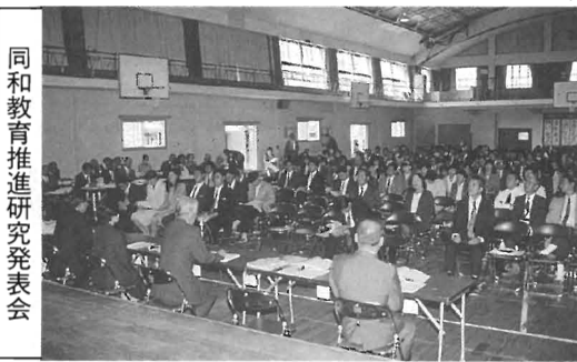
同和教育推進研究発表会

要するに、部落差別は、同和地区のみならず、社会全般に普遍的に存在するものであり、それが解決されない限り、日本の社会全体に真に民主化は実現しないと