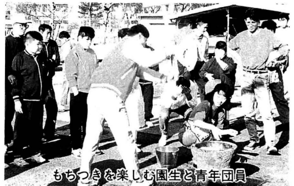
もちつきを楽しむ園生と青年団員