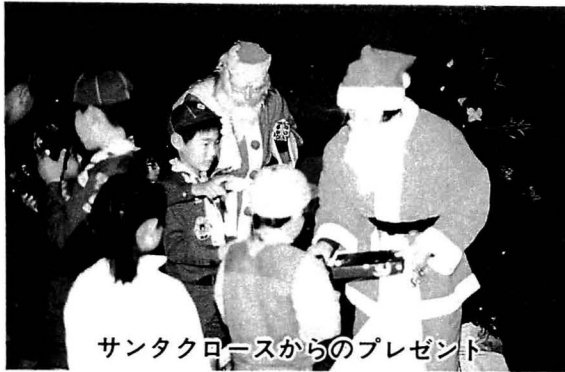
サンタクロースからのプレゼント

園では、さっそく昼食につきたてのもちを賞味し、一足早いお正月のプレゼントに大喜びでした。