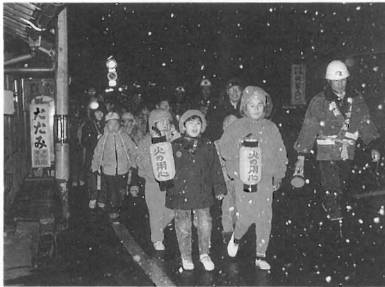
12/26「火の用心」 雪の降る中おこなわれた 子供による年末特別夜警