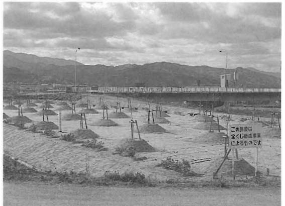
コミュニティ助成事業により整備された 川上西地区コミュニティ広場