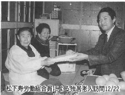
12/22 独居老人訪問による組合員労働者寿松下