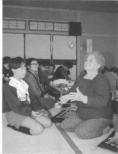
12/15老人クラブを対象とした ↓松山大学生による川内寄席

(2)休養・保養のためなら、温泉地の環境も積極的に利用する健康な人が、日ごろの心身の疲れをとるため、あるいはレクリエーションをかねて温泉に行く場合は、とくに泉質にこだわる必要はありません。自分の体調にあわせて、適当な温泉地をきめるとよいでしょう。日ごろ運動不足の人は海辺や高山、ストレス解消のためなら森林など、温泉地の環境も積極的に利用すれば効果的です。