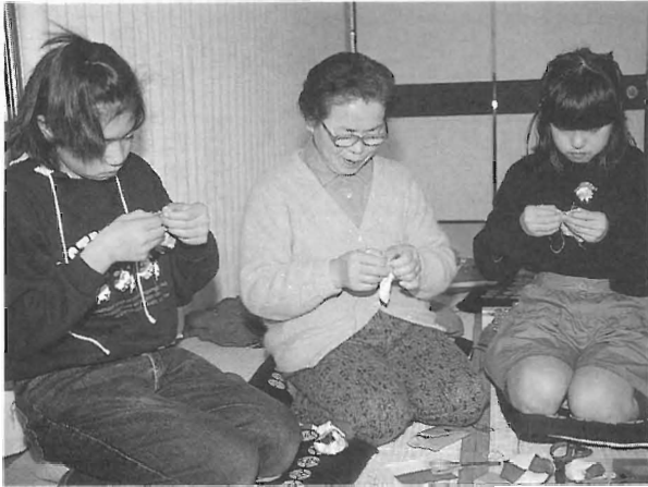
↑12/24子供と高齢者のふれあい事業 ←お手玉づくり