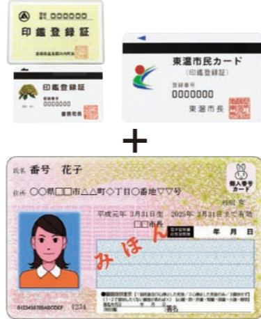
今回の改正でマイナンバーカードも使用できるようになる(本人に限る)

マイナンバーカードは、コンビニでの証明書の交付に加えて、今回の改正で自ら申請する場合に限り、窓口での交付が可能となる。