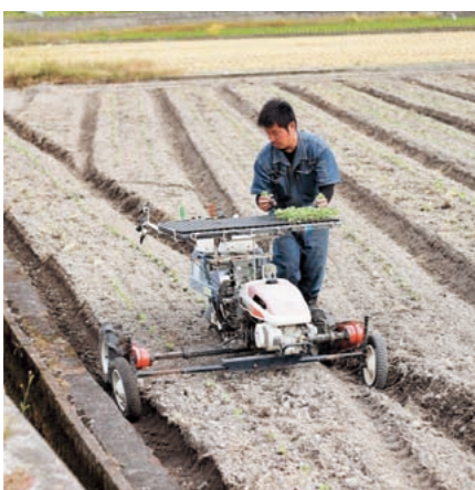
移植機による ブロックローの植え付け

機械やハウス等の施設を導入するJA等に補助金を交付する事業で新規就農者の育成に積極的に取り組むJA等として、研修施設を持つJAえひめ中央が対象となる。 JA等が新規就農者の要望を取りまとめ、市を経由して県に事業要望し、県が採択の審査を行う。