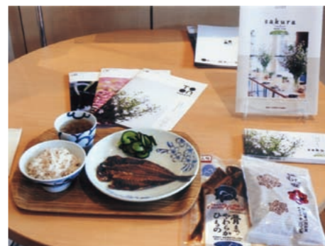
「まるっと」と「もち麦関連商品」

許認可権者である愛媛県と除外の協議を進めている。国営道前道後平野土地改良事業が完了した平成26年3月31日から8年経過後の令和4年4月1日以降に吉久地区の法手続きを進めることが可能となる。令和3年度までに愛媛県との事前協議を終了し、令和4年度に許認可手続き、その後、用地取得、造成工事を経て、令和7年度の用地引渡しをめざす予定としている。