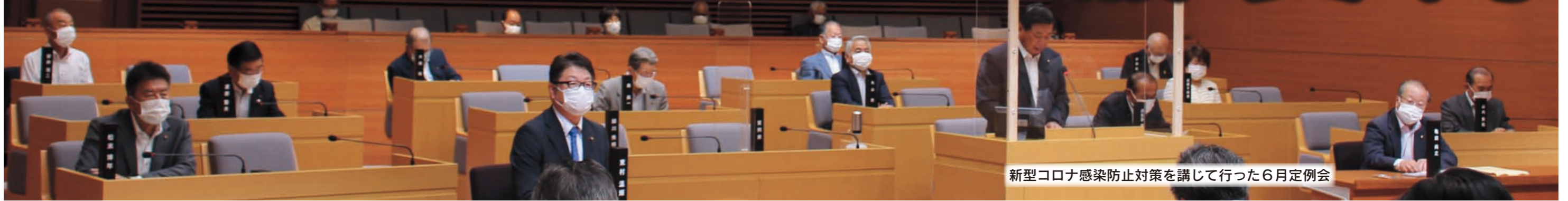
新型コロナウイルス感染防止対策を講じて行った6月定例会