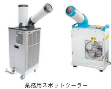
業務用スポットクーラー

避難所を開設する際は、市のマニュアルに基づき感染症対策を徹底する。多数の避難者を受け入れる必要があるため主に小中学校の体育館を使用するが、熱中症等の対策としてスポットクーラーを応急的に設置し、備蓄している大型扇風機で換気を促す方法も考慮したい。