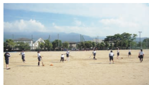
再開された部活動

分譲選考委員会を設置し、公募の上、企業概要・事業計画・地域貢献度など総合的に判断し選定した。