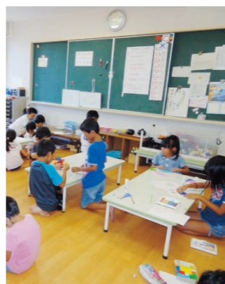
児童クラブで過ごす子どもたち

答 北吉井小学校の運動場や体育館の使用も視野に入れ、クラス分けについても今後検討していく。