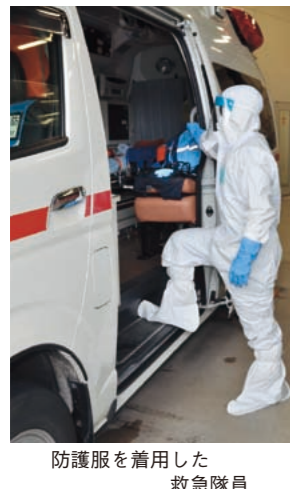
防護服を着用した救急隊員

答 感染症の疑いのある患者・感染患者の身体に直接触れる医療行為、消防本部の救急搬送等が対象となる。