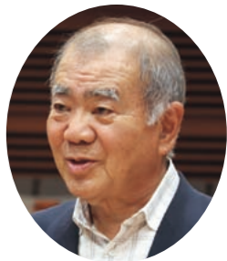
大西 勉 議員