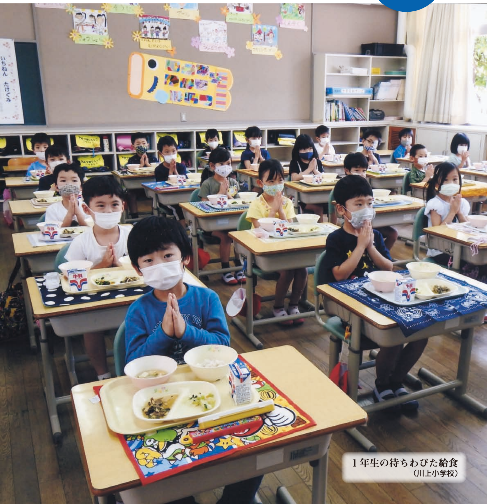
1年生の待ちわびた給食 (川上小学校)