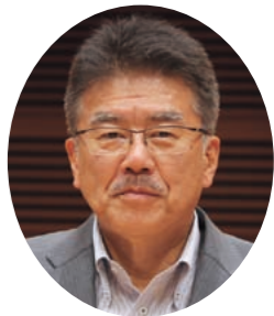
松末 博年 議員

を受けた国の10万円の一律給付に合わせ、石川県志賀町では町民1人につき2万円を上乗せする独自の給付制度を設ける。財源は職員の給与カットで約8千万円分を確保し、残りは財政調整基金や新型コロナウイルスの影響で中止されたイベントに充てる運営費で賄う。 また、4月に日本モーターポーター選手会が日本財団に1千万円を寄付、さらに丸亀ポーターレース場で優勝した女性騎手が優勝賞金から100万円を日本財団と元SMAPの香取慎吾さんらが創設した「愛のポケット基金」に寄付した。 宮島ポーターレース企業団は、新型コロナ対策の財源として、広島県へ1億円、広島市へ3千万円、場外舟券売り場がある呉、安芸高田両市へ各1千万