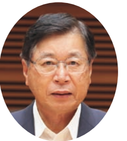
細川 秀明 議員