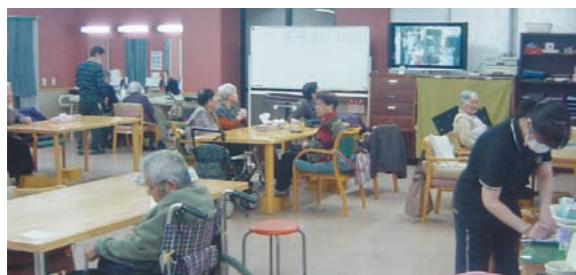
よりよい介護保険制度を

県下で一番高い理由の一つには、市内に各種医療機関や介護関連施設が多く設置されていることに加え、松山市に隣接しているため、松山圏域の施設も利用しやすいという環境がある。また、介護認定率の高さにも要因があり、平成29年度時点における本市の過去5年間の平均は22.14%で県平均20.84%と比較すると1.3ポイント高い。県内他市町と比較