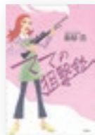
ママの狙撃銃 著/荻原浩

アニメ制作の裏側が面白いお仕事小説！プロデューサーや監督、原画マンなどが登場し、章ごとに主人公が代わるのも面白いです。一番視聴率の高いハケン（覇権）アニメを目指し、それぞれの役割で奮闘します。声優さんの収録の仕方や制作の過程が詳しく描かれているのでアニメ好きの方におすすめです。