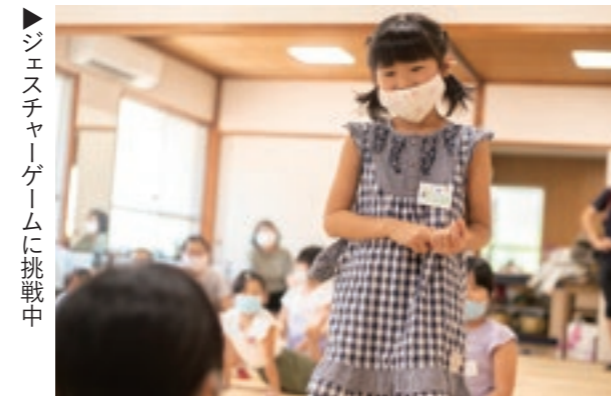
▶ジェスチャーゲームに挑戦中