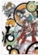
ハケンアニメ！ 著/辻村深月