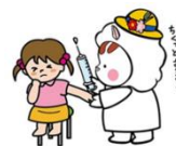
東温市イメージキャラクター いのどん

東温市では、定期予防接種を下記のとおり実施しています。 対象年齢の方は予防接種についての説明書等をよく読み、接種を希望される場合は十分理解した上で体調のよい時に予防接種を受けましょう。