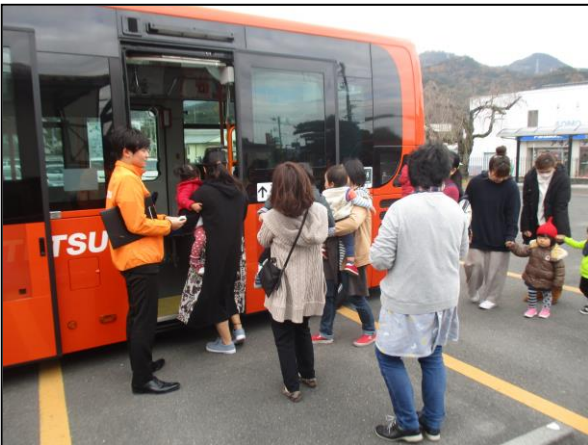
＜路線バス親子体験教室の様子＞

新型コロナウイルス感染拡大防止のため、令和2年度は開催を見合わせていたが、ワクチンの普及等、感染状況を注視し、万全の対策を講じながら出来る限りの実施を目指す。