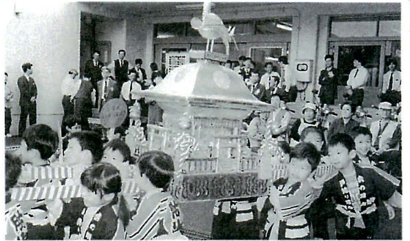
元気にお神輿もかきました