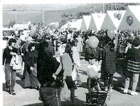
バザー(7日)も大にざわい

町民会館・図書館などを会場に、三日間、多くの人が音楽・映画・書道・囲碁など多彩な文化に触れました。