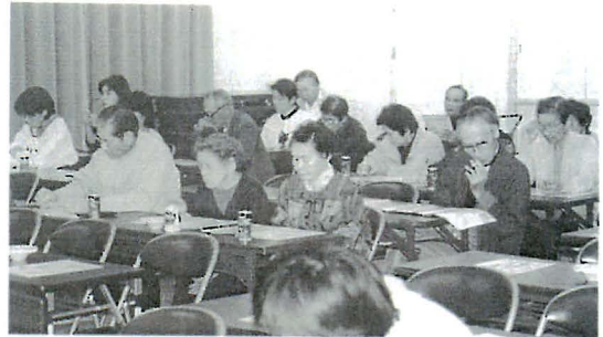
地区説明会の様子