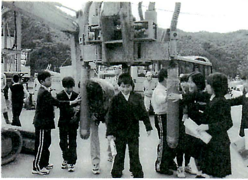
ものすごい振動にびっくり

ダムは、平成一三年春に完成し、一年間安全性などを確認した後、いよいよみなさんの大事な水を守っていく予定です。