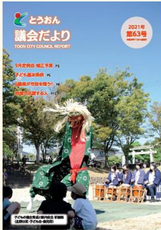
【表紙の写真】子どもの健全育成と家内安全 祈願祭 (北野田区・子ども会・健児団)