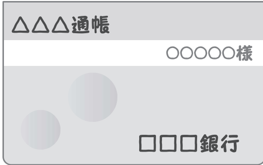
通帳の表紙のコピー